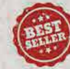
원산지: 소프트 크랩(미얀마)

그릴에 구운 양배추, 바삭하게 튀겨낸 소프트크랩 Battered fried soft-shell crabs served with baked cabbage